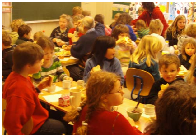
Til høyre: Solboller, kakao og sang inne på skolen.