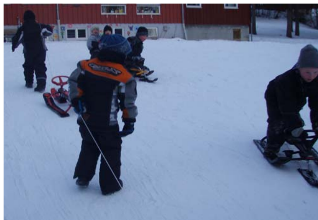
Til høyre: Lek i akebakken