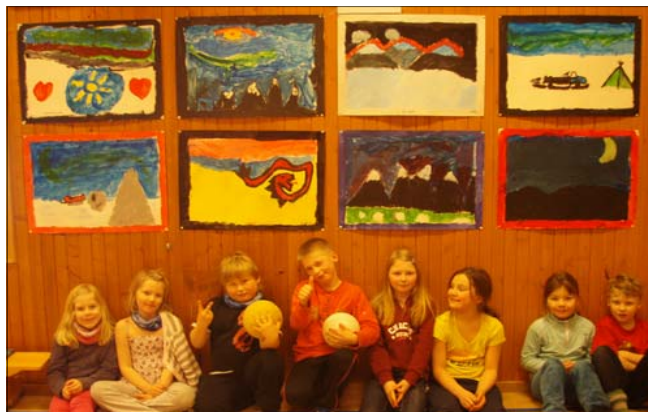
Bildet over: Tredje klasse sine verk

Uke 5 fikk alle sin årlige kunstneriske utfoldelse. Alle elevene og SFO hadde i løpet av uka kunstmaling over temaet: VINTER/-FARGER. Elevene fikk full kunstnerisk frihet over temaet. En del av resultatene kan sees her. Kunstuka avsluttes alltid med utstilling i gymsalen hvor rektor serverer brus og kjeks, mens kunstverkene beundres og diskuteres. De eldste klassene vil bruke dette materialet i en powerpoint framstilling senere, - kanskje på et foreldremøte?