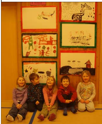
Bildet til venstre: Første klasse sine temabilder