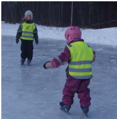
Til venstre: Første skøytebakke (førskole)