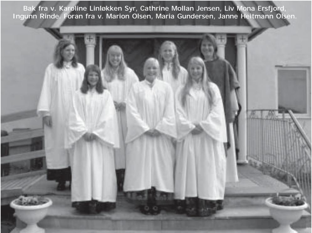
Konfirmasjon i Berg kirke 9. mai