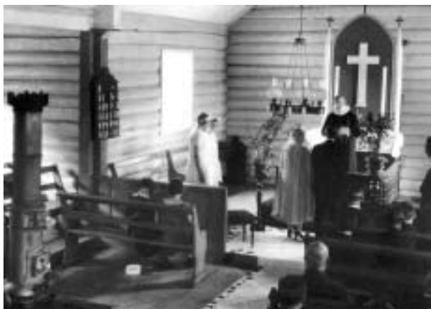
Vielse i Torsken kirke rundt 1930.