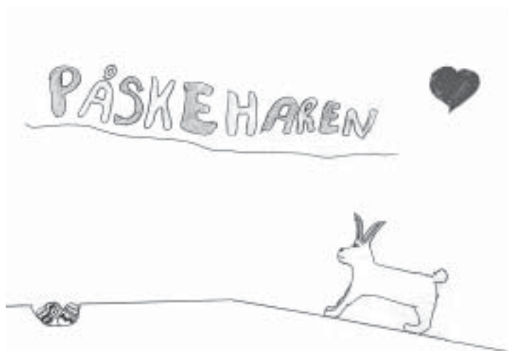
tegnet av Kristine