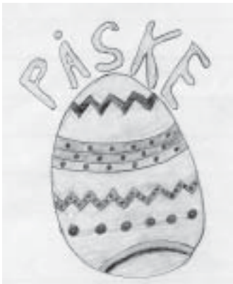
tegnet av Thomas