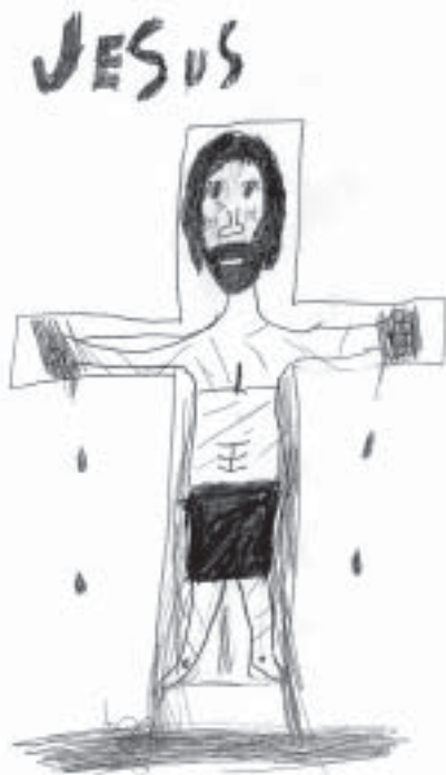
tegnet av Karianne

12. april er det 60 år siden tragedien på Svendsgrunnen 1943, hvor mange fiskere fra Yttersia måtte bøte med livet i et uforståelig angrep fra russerne. På gudstjenesten i Gryllefjord Palmesøndag (13. april) vil vi foreta en enkel markering av dette.