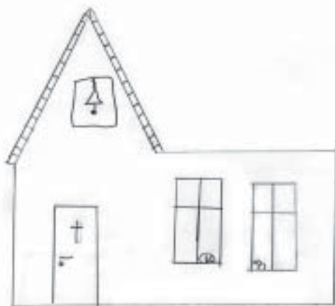
tegnet av Camilla