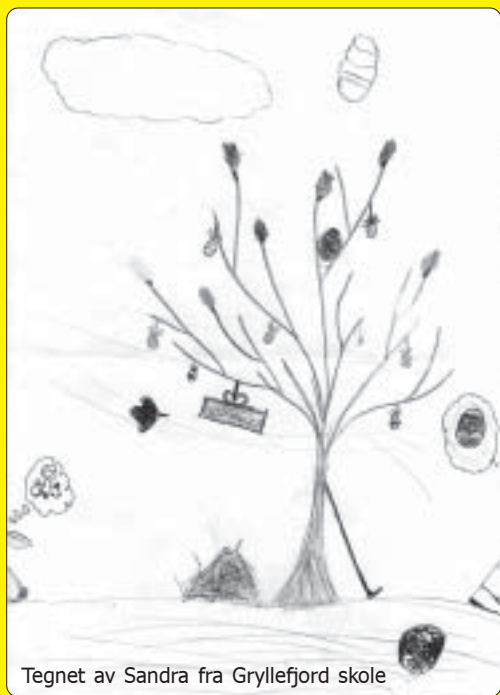
Tegnet av Sandra fra Gryllefjord skole