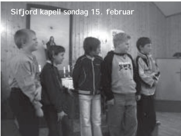
Sifjord kapell søndag 15. februar

Det er 5. klassingene på Medby skole som har levert tegninger til dette nummeret. "Påske og påskeferie" var bestillingen. Her ser de visst for seg litt forskjellig - noen med mye snø og lys på fjellet, andre på mer sydlige breddegrader kanskje. Tusen takk til dere!