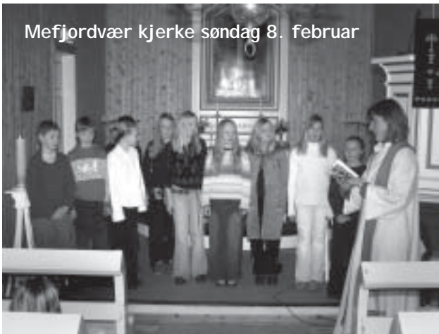
Mefjordvær kjerke søndag 8. februar

Det er 5. klassingene på Medby skole som har levert tegninger til dette nummeret. "Påske og påskeferie" var bestillingen. Her ser de visst for seg litt forskjellig - noen med mye snø og lys på fjellet, andre på mer sydlige breddegrader kanskje. Tusen takk til dere!