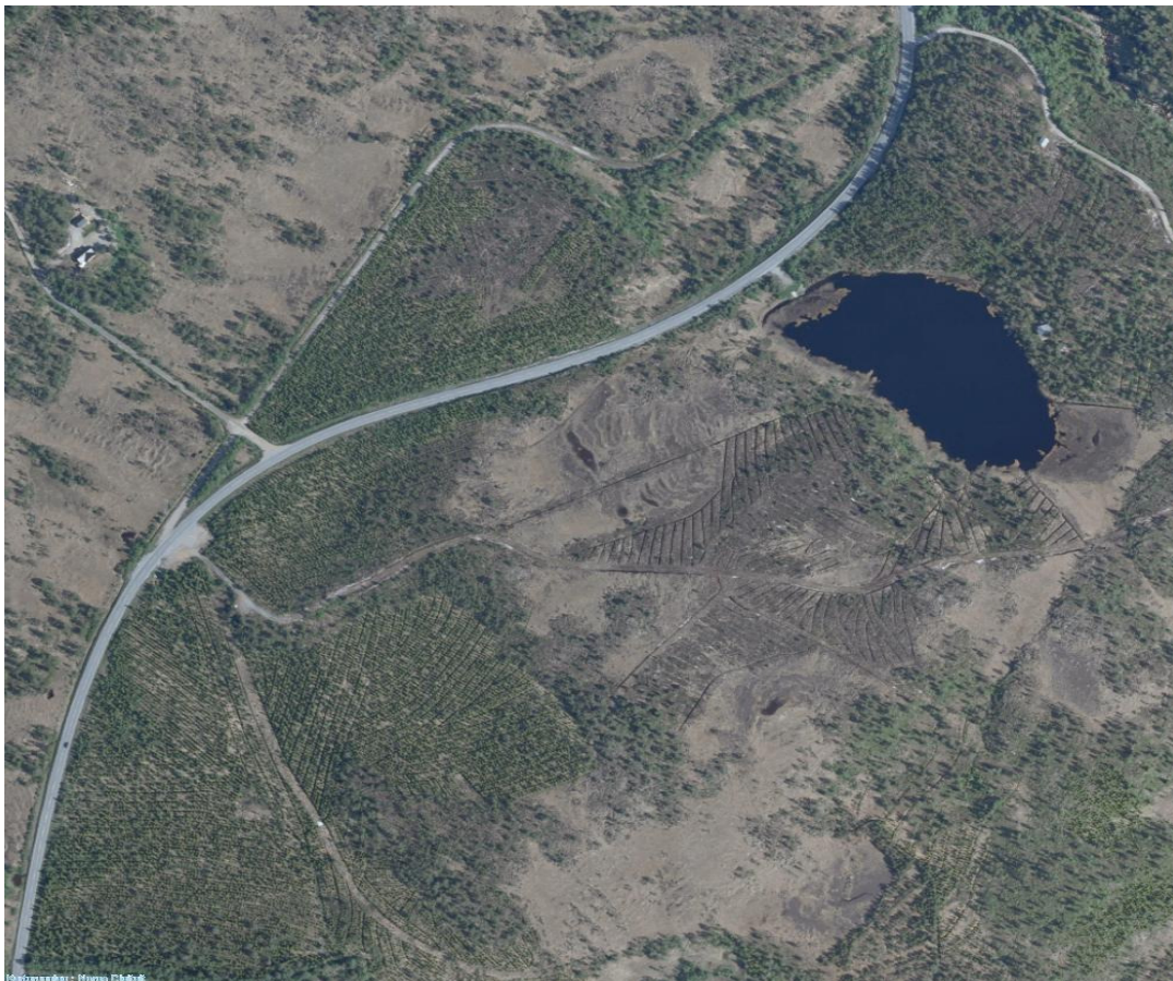
Området Snilldalsæter i flyfoto

Formålet med planarbeidet er å legge til rette for vekst og utvikling i regionen ved å tilby industriområder til bedrifter som ønsker å etableres seg i området Orkdal og Snillfjord.