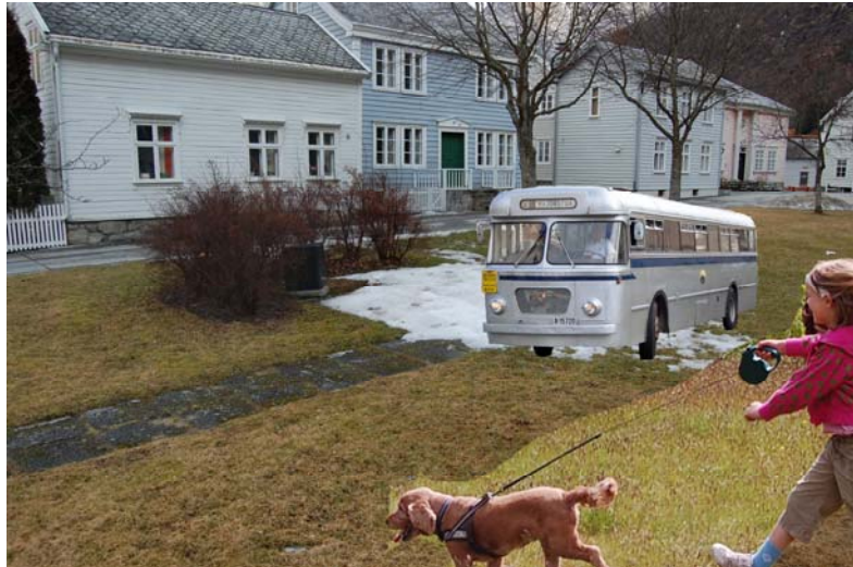
Mogelegheit for plassering av leikeapparat i parken.

Den eksisterande parken som ligg ved Holdeplassen kan med fordel opprustast. Ein gamal buss i miniaturutgave kunne høve bra som "kulturhistorisk" leikeapparat.