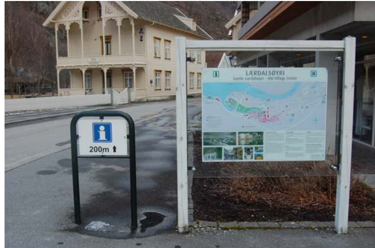
Infoplass ved Lindstrøm hotell

Infoplassens plassering gjer at dei besøkande får god informasjon før dei tek seg inn i området. Dette kan gjerast som ved innkøyringa i vest der ein har ein tilsvarande infoplass.