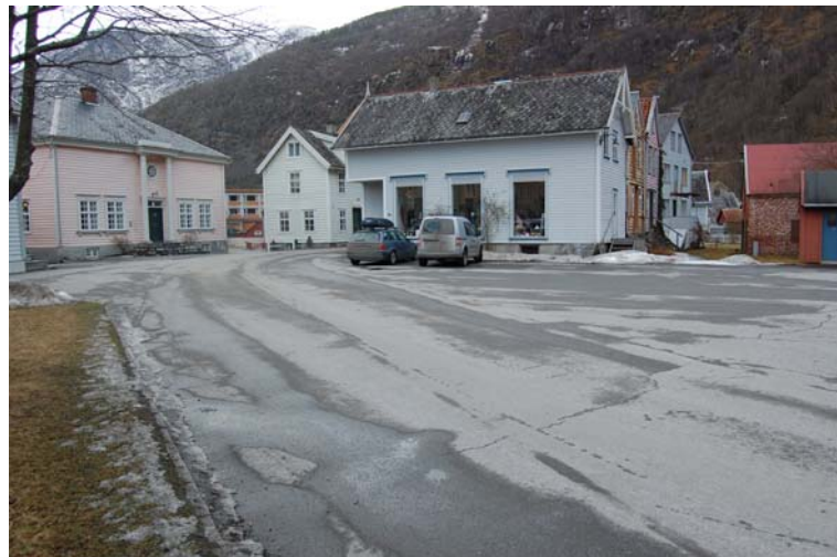
Holdeplassen er i dag ein stor utflytande plass.

Torg 2 og torg 3 dannar ein stor plass inne på Holdeplassen som visuelt vert delt i to av dekket som vert nytta på gågata. Dette gjer at plassen er godt egna som marknadsplass og arena for sykkelløp.