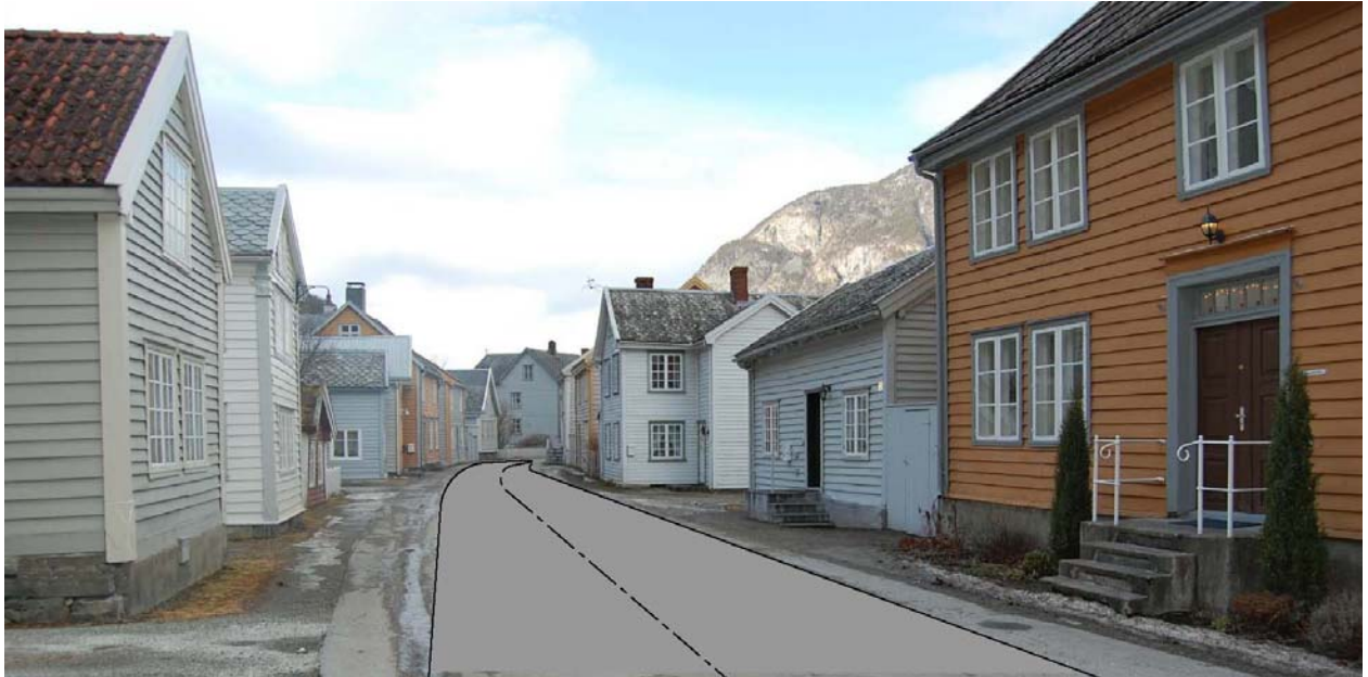
Visuell oppstramming av gågata ved bruk av ulike dekketypar.

Det er gjort vedtak på å stenge delområde 1 for køyrande og definere gata som gågate.