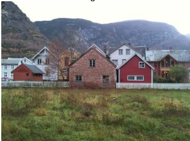
Plassering av parkeringsplass for tilreisande.

Det er lagt inn to nye parkeringsplassar i Ulviksmorki då det er trong for fleire parkeringsplassar for både fastbuande og tilreisande.