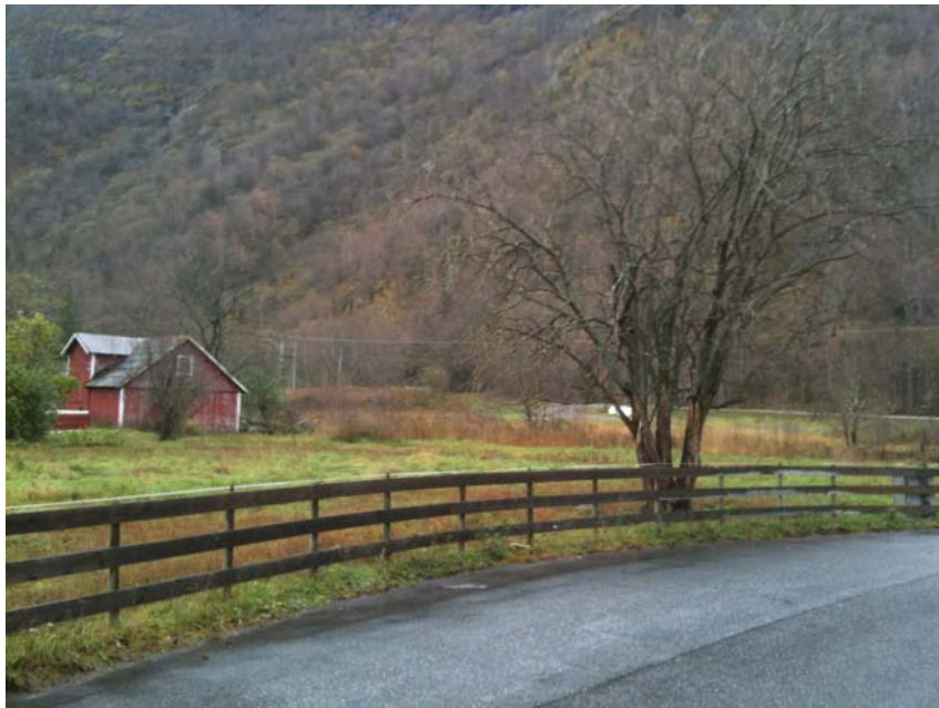
Vegetasjonsskjerm i Ulviksmorki.

På grunn av dei nye løysingane for plassering og auka trong for parkeringsplassar har noko av landbruksarealet i gjeldande reguleringsplan fått nye reguleringsføre mål i detaljreguleringsplanen som no vert lagt fram. Grensa for landbruksarealet er trekt mot riksvegen slik at det den vert liggande meir i flukt med busetnaden i aust. For å oppretthalda buffersona rundt verneområdet er det lagt inn ein vegetasjonsskjerm, som kan utformast som ein frukthage, inn mot parkeringsarealet.