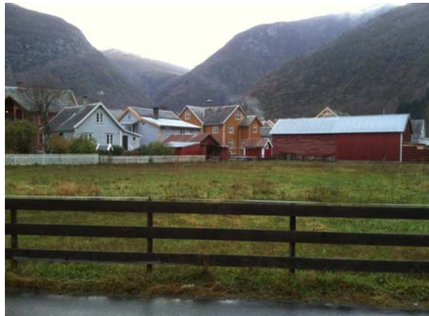
Plassering av parkeringsanlegg tilpassa busetnaden.