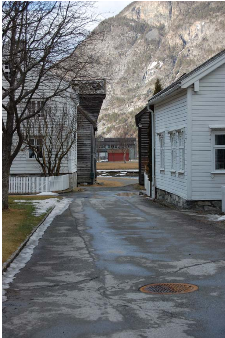
Gågata endar på Løytnantsbrygga

Når gågata kjem ut på Holdeplassen er den visuelt retta mot den gamle vegen som gjekk ned mot Løytnantsbrygga.