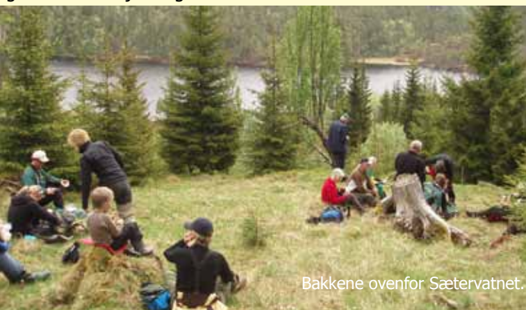
Bakkene ovenfor Sætervatnet.