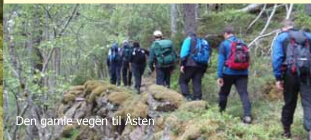
Den gamle vegen til Åsten