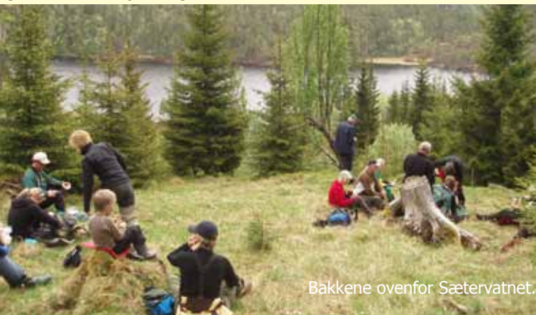
Bakkene ovenfor Sætervatnet.