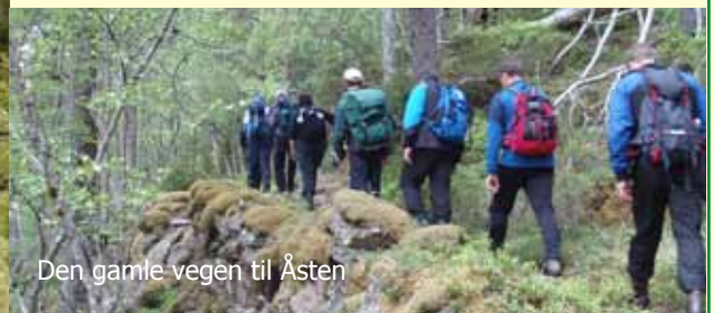
Den gamle vegen til Åsten