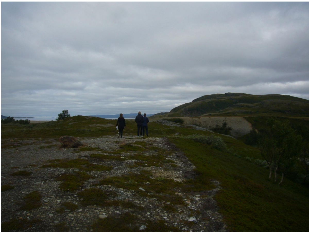
Fra Storberget – utsyn mot nord

Igangsetting av planarbeidet ble annonsert og varslet i brev av 22.02.2011 til berørte grunneiere, offentlige instanser og andre berørte parter.