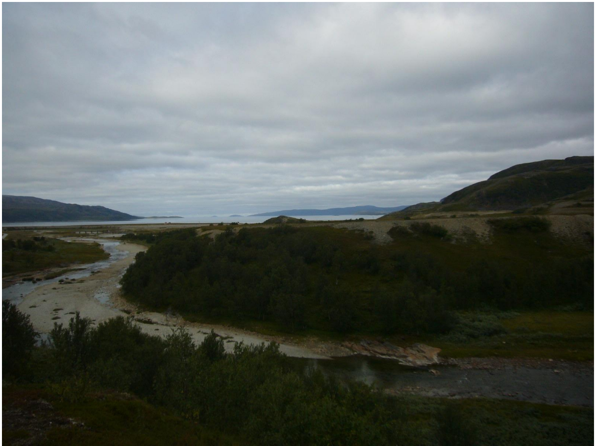
Fra Storberget – utsikt mot Russelva og fjorden