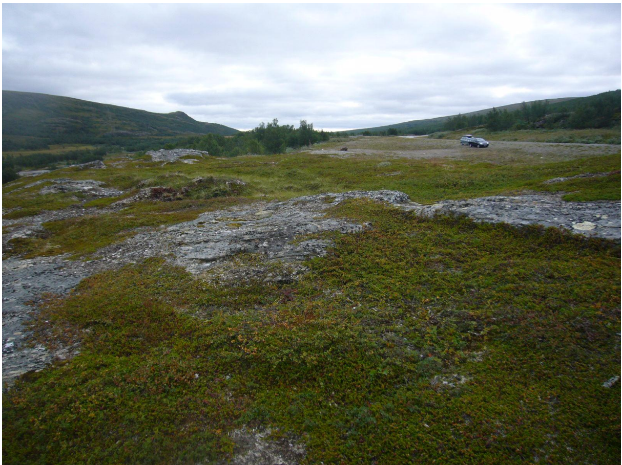
Fra Storberget – området sett mot syd