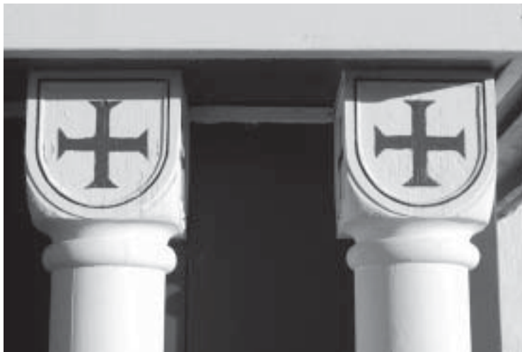
Detalj fra inngangen til Berg kirke