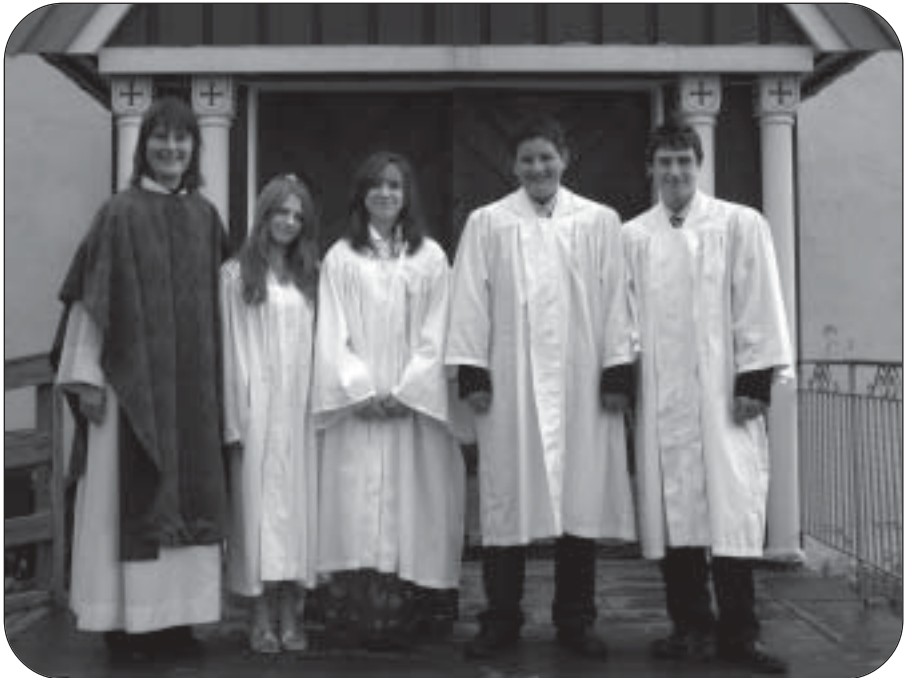
Konfirmasjon Berg kirke 29. mai 2005