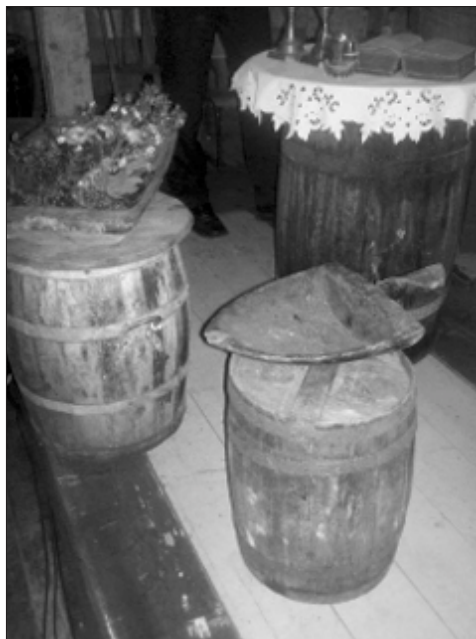
Alter og prekestol

Å høre det bli ringt inn til gudstjeneste med en gammel skipsklokke, å synge lokalt diktete salmer om havet som gir og tar og at Gud er med oss i mot - og medgang, se prekestol og alter være byttet ut med sildetønner dekorert med blonder og blomster fra naturen - ja, det gjorde dette til den gudstjenesten vi vil huske. Sammen med lukt av salt og tørrfisk, som fortsatt sitter i veggene i Kråkeslottet, fikk vi følelsen av at det er jo også her Gudsordet hører hjemme - her hvor havet,