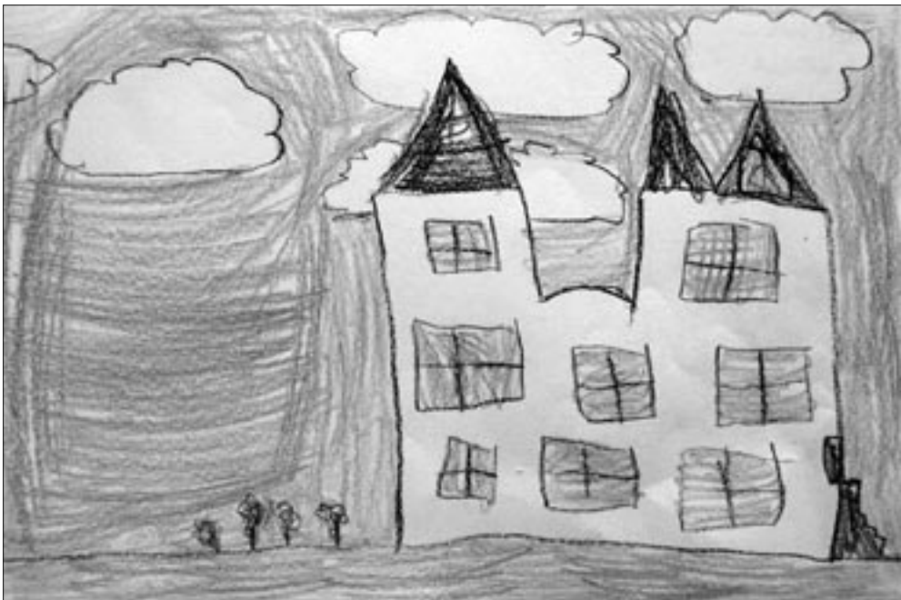
Kathrine, 1. klasse