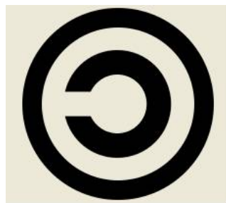
Copyleft – all rights reversed

Programvare som er utviklet i tråd med FSF sin tankegang, er underlagt lisens selv om man velger å distribuere den gratis; en lisens som skal sikre at "copyleft"-prinsippet følger koden i all framtid.