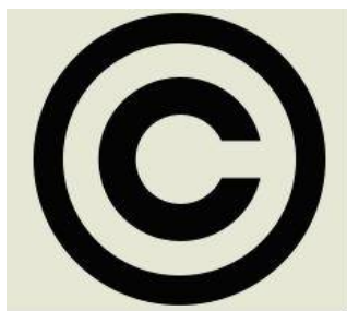
Copyright – all rights reserved

Når programvare er fri i FSF sin betydning av ordet, kan hvem som helst bruke den som de ønsker, men aldri gjøre den "ufri". Eventuelle endringer som videreformidles, deles eller selges må være frie, på samme måte som originalen. Denne tankegangen blir omtalt som "Copyleft" – for å poengtere motsetningen til "Copyright". Dette er illustrert gjennom symbolbruken i følgende figur 7 .