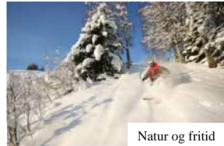
Natur og fritid