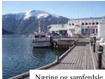
Næring og samferdsle