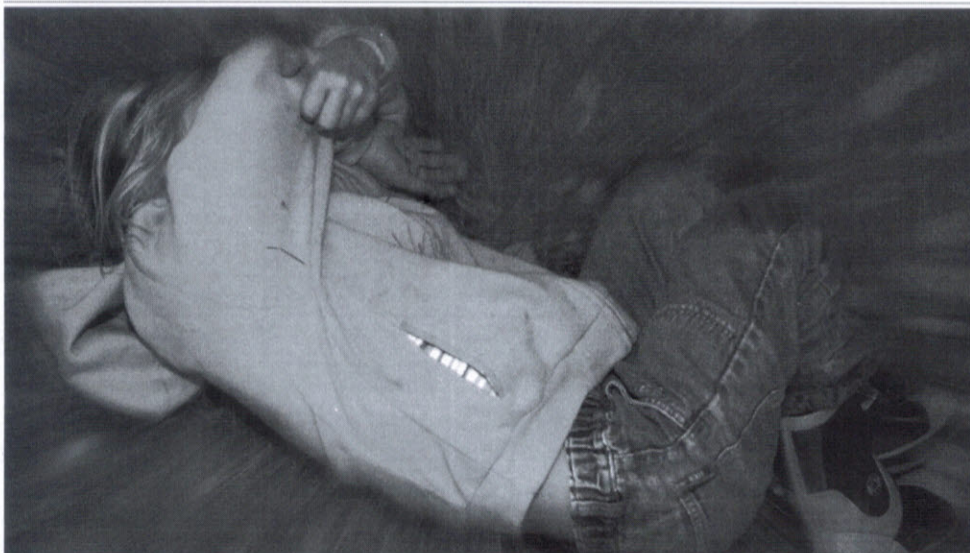
MISTE OMSORGEN: Foreldre som er konflikt drivende bør miste omsorgen for barna, mener Foreningen 2 Foreldre. - En langvarig konflikt mellom foreldrene er skadelig for barn, påpeker foreningen.