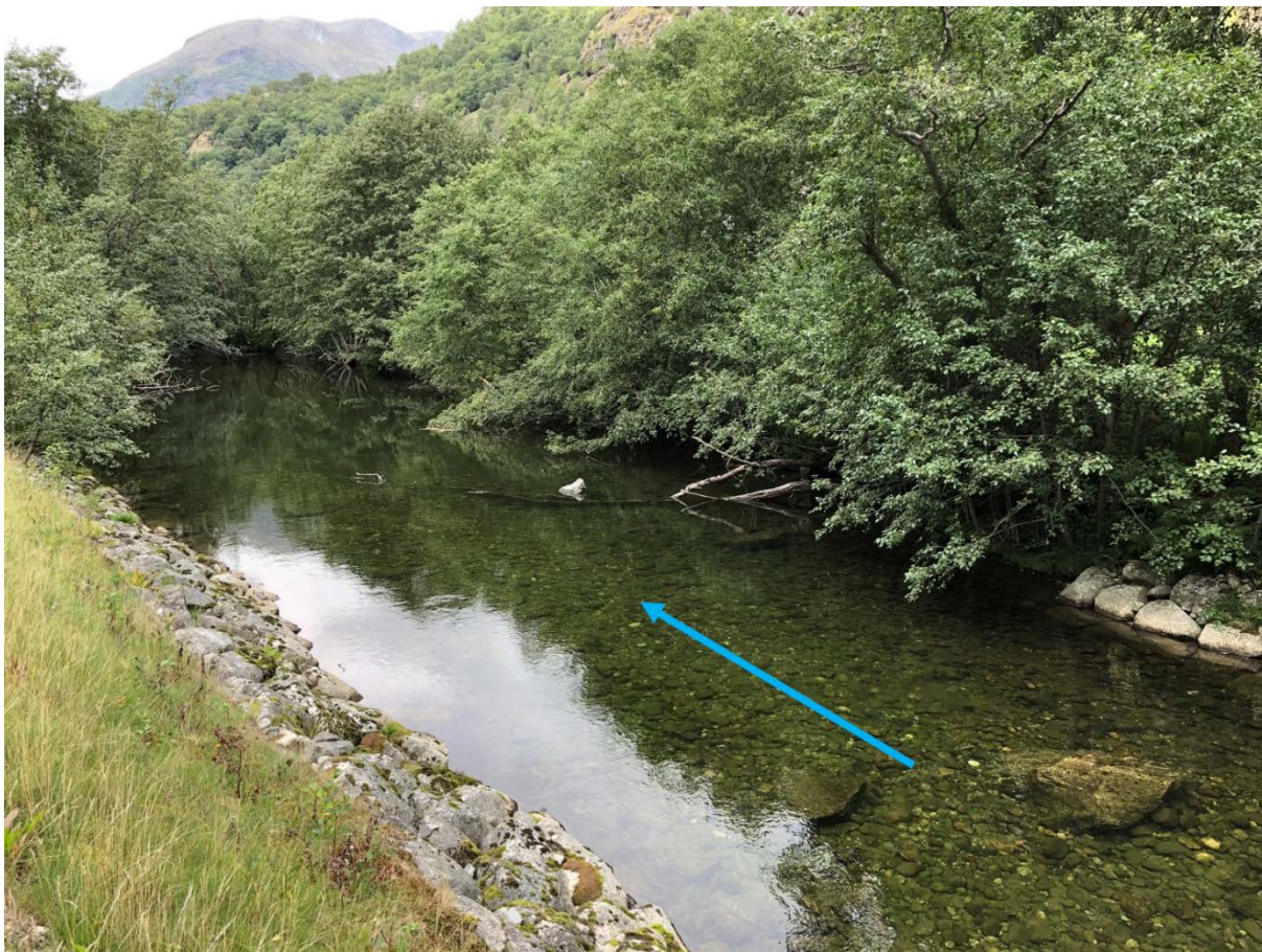
Figur 9: Hovudløpet i den restaurerte Seltakilen ved Seltun. Straumretninga er vist med blå pil. Tett vegetasjon rundt kilen gjev skugge, skjul og god næringstilgang for fisk.

Med miljøtiltak meiner vi i denne planen to hovudtypar: restaurering av (del av) vassdraget og habitattiltak.