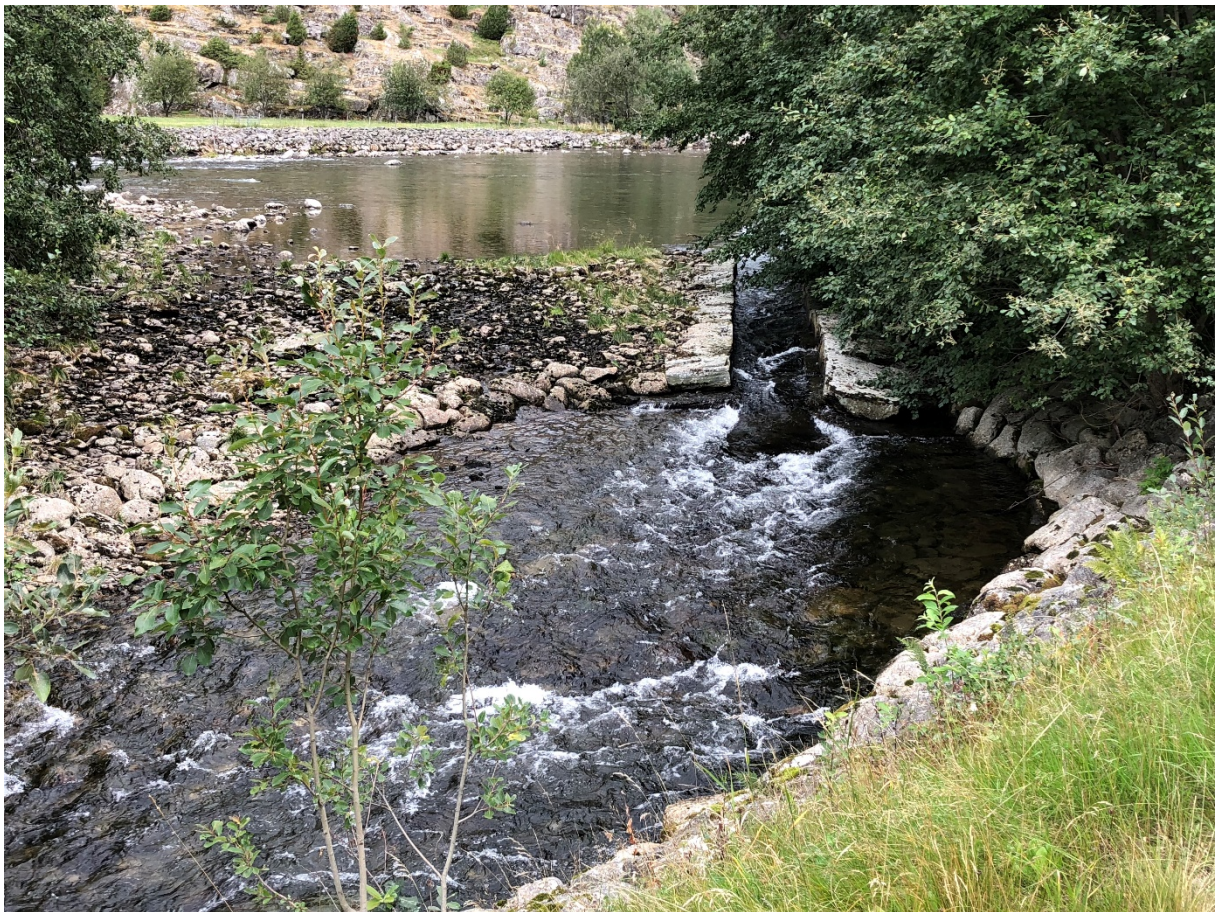
Figur 2: Vassintak til Seltakilen, Seltun. Kilen vart restaurert i samband med Statens Vegvesen si oppgradering av E16. Hovudelva renn mot venstre i bakgrunnen.

Større sidevassdrag er til dømes Kvemma ved Øvre Kvamme, Dylma, Kvemma ved Nedre Kvamme, Nivla, Senda, Kuvelda og Ofta. I den relativt flate dalbotnen er det mange kilar (sjå døme i Figur 2), sideløp og sidevassdrag som anadrom laksefisk kan nytte til gyting og oppvekstområde. Desse delane av vassdraget fører òg næring ut i hovudelva. Fleire av områda har redusert funksjon for anadrom laksefisk på grunn av fysiske tiltak eller manglande vedlikehald.