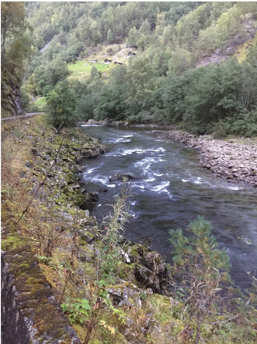
Figur 7: Hølen "Portman" syner i framgrunnen, husmannsplassen Galdane syner i bakgrunnen.

Tiltak i vassdraget som ikkje har nemneverdige negative verknader for allmenne interesse og ikkje er eit «vesentleg terrenginngrep» etter plan- og bygningslova, treng ikkje løyve etter vassressurslova eller plan- og bygningslova (NVE, 2017b). Tiltaket skal likevel bli vurdert etter lakse- og innlandsfisklova og naturmangfaldlova med forskrifter når tiltaket har verknad for villaks og natur.