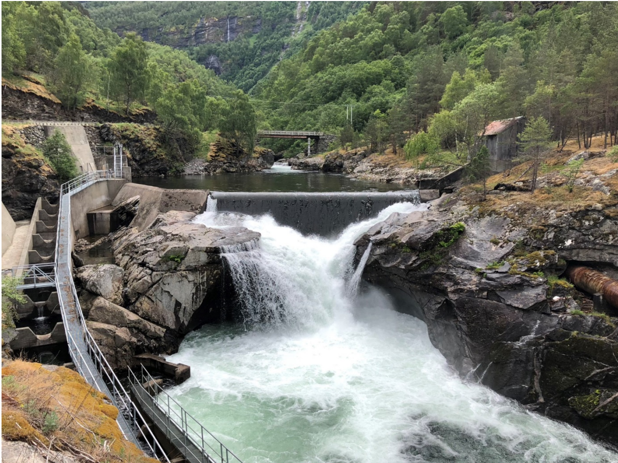
Figur 4: Fisketrapp ved Husum.

Det er mange fysiske tiltak i vassdraget. Døme på slike er forbygging, tersklar, utstikkarar, kulvertar, bruer, erosjonssikring, regulering, vassuttak. Døme på verknader av fysiske tiltak er endring i dei naturlege leveområda for fisk, stenging eller forringing av oppvekst- og leveområde for fisk, endringar i vassføring og vasstemperatur og sediment som vert virvla opp under arbeid i elva. Det er gjort nokre kompensierende tiltak i vassdraget, som bygging av fisketrappar (fisketrappa ved Husum er vist i Figur 4), restaurering av kilar og habitattiltak.