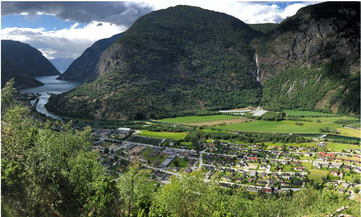
Figur 3: Lærdalselvi, tett busetnad og landbruksareal i området rundt Lærdalsøyri. Biletet er tatt med "panorama"-funksjon (vidvinkel).

Landbruket dominerer arealbruken langs elva. Det er avsett areal til næring og industri nokre stader. Det er tett busetnad ved Lærdalsøyri, Ofta, Saltkjelen og Borgund, og elles spreidd busetnad og landbruksdrift langs vassdraget. Området ved Lærdalsøyri er vist i Figur 3.