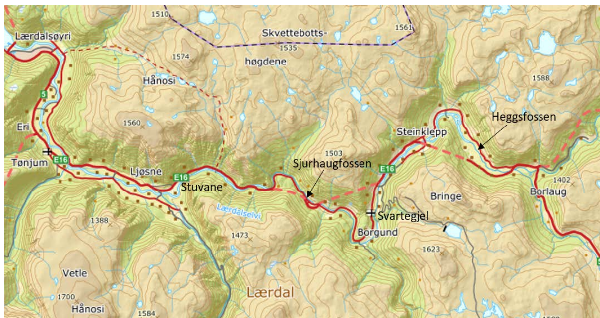
Figur 1: Kartet viser Lærdal frå samløpet mellom Smeddøla og Mørkedøla ved Borlaug til munningen av Lærdalselvi ved Lærdalsøyri. (Kartet er tilpassa frå Norgeskart.no).

Lærdalselvi blir danna der Mørkedøla frå Hemsedalsfjellet og Smeddøla frå Filefjell renn saman ved Borlaug, litt ovanfor Heggfoss (Figur 1).