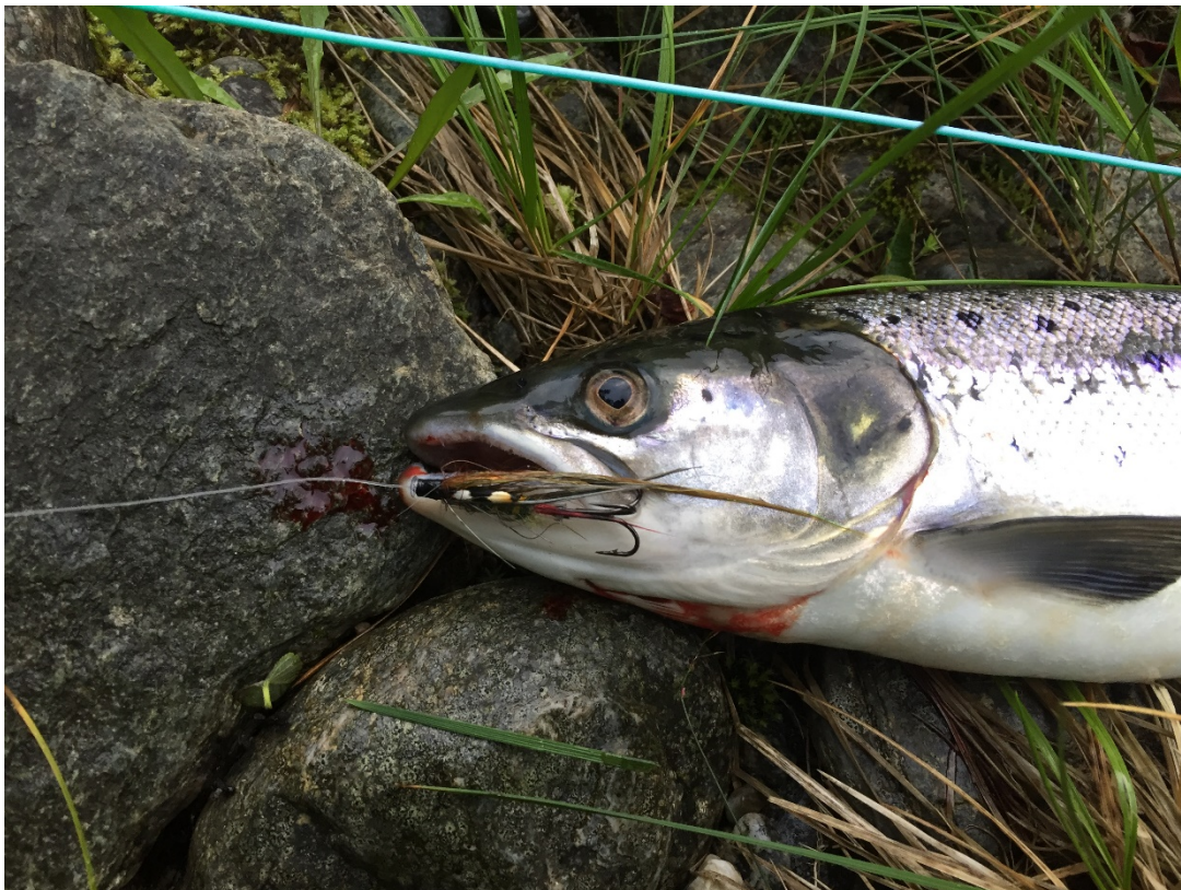
Figur 5: Lærdalslaks tatt på fluge.

Laks og sjøaure er dei dominerande fiskeartane i anadrom sone. Dei vandrar naturleg til Sjurhaugfossen, om lag 25 kilometer frå sjøen. Ved hjelp av fire fisketrappar kan fisken vandre til Heggfoss, om lag 16 kilometer oppstrams Sjurhaugfossen. (Den øvste fisketrappa, ved Svartegjel, er stengd medio 2019.) Sjøauren nyttar i hovudsak nedre del (Lærdalsøyri-Stuvane) og laks i hovudsak øvre del (Stuvane-Sjurhaugfossen) til gyting og oppvekstområde. Ovanfor Sjurhaugfossen er det ein god brunaurestamme. Det er òg ørekyte, skrubbflyndre og ål i vassdraget i tillegg til stingsild ved munningsområdet.