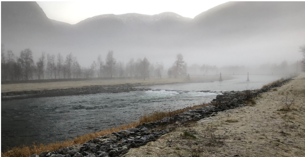
Figur 10: Engelskmannsbrui frå Nedre Eri (høgre biletkant) til Molde/Færestad. Terskel nr 46 syner eit stykke nedstraums brua.

Sikringstiltak er til dømes sikring mot erosjon og overfløyming. Når klimaendringar fører til større nedbørmengder, meir ustabil vêr og meir ekstremvêr kan det gje oss nye og forsterka utfordringar på korleis vi skal handtere vatnet. Nye, større sikringstiltak vil bli planlagde som del av reguleringsplan og blir ikkje drøfta her. Mindre sikringstiltak som vert utforma slik at dei ikkje har konsekvensar for allmenne interesser treng ikkje konsesjon (NVE, 2017b). Slike tiltak kan ein søke om til kommunen, som vil sende søknaden på høyring til Fylkesmannen om laks og sjøaure kan bli påverka av tiltaket.