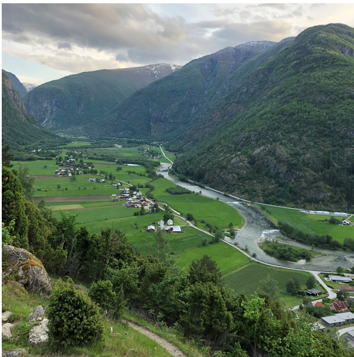
Figur 11: Lærdal sett mot sør frå stien til Oftedalen. Erisåsen ligg på motsett side av elva. Byggefelt i Ofta syner i nedre, høgre biletkant. Oppover dalen ser ein Hunderi, Skjær, Hauge, Nedre Eri.

Internett: https://www.laerdal.kommune.no/