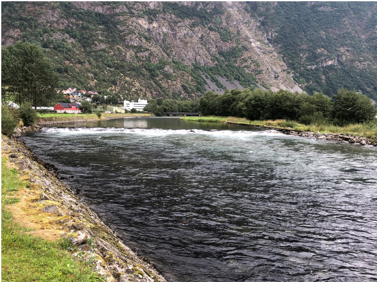
Figur 6: Terskel 18 viser midt i biletet, med hølane Øvre Chaplin (nærast) og Bruhølen (ovanfor terskelen). Sjukehusbrua og sjukehuset (kvitt bygg) viser i bakgrunnen. Eldre sikringstiltak syner til venstre i biletet.

Historia med støtte frå staten til sikringstiltak i Lærdalsvassdraget går tilbake til midten av 1800- talet. Elva har flaum- og erosjonssikring eller forbygging mot veg langs store delar. Mange stader er det tiltak på begge sider av elva. Erosjonssikringane ligg tett på elva medan flaumsikringane vekslar mellom å ligge langs elva eller noko tilbaketrekt. Ny flaumsikring av Lærdalsøyri er under planlegging.