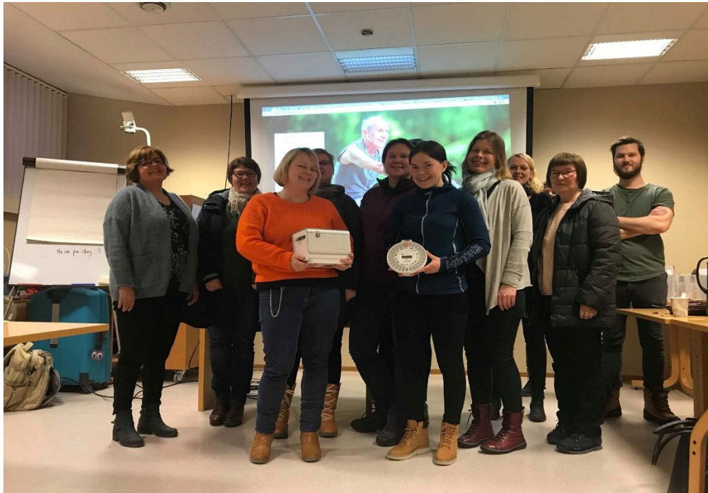
Bilde fra opplæringen med Dignio, ansatte fra Kåfjord, Lyngen, Nordreisa, Skjervøy og Kvænangen.