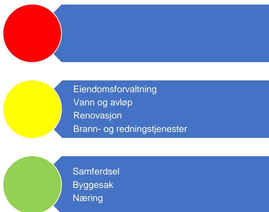
Figur 6. Risikovurdering teknisk

Revisor sin samlede vurdering av risiko og vesentlighet relatert til teknisk drift tilsier at behovet for forvaltningsrevisjon innenfor ulike tema er moderat eller lavt.