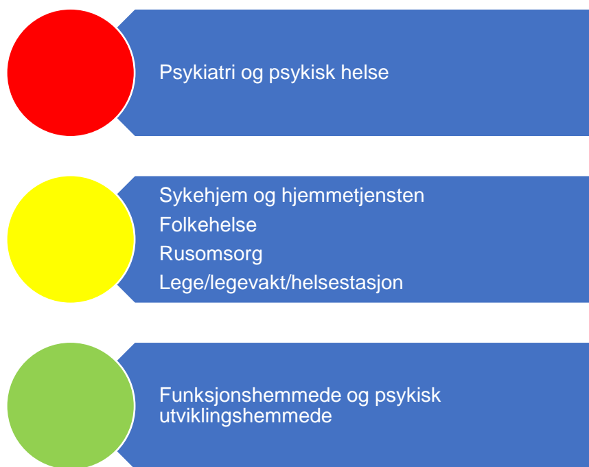
Figur 5. Risikovurdering helse og omsorg

I figur 5 er risikovurderingen innenfor helse- og omsorgstjenester oppsummert.