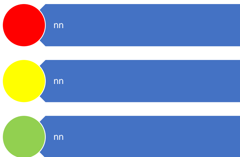
Figur 9. Risikovurdering

Risikovurderingene er oppsummert i figur to og visualisert som trafikklys. Vurderinger som fører til henholdsvis lav, middels og høy risiko plasseres der de hører til i figuren.