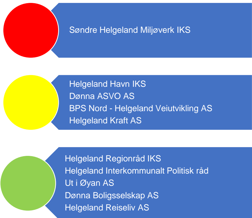
Figur 7. Risikovurdering eierskap

I figur 7 er risikovurderingene knyttet til kommune sine eierinteresser oppsummert og grunnlaget for vurderingene er nærmere vurdert i fortsettelsen.