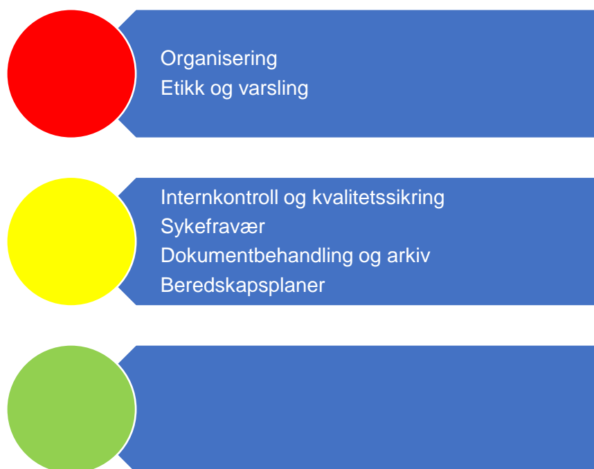
Figur 2. Risikovurdering organisasjon

Revisor sin samlede vurdering av risiko og vesentlighet relatert til organisasjon tilsier at behovet for forvaltningsrevisjon innenfor organisering og etikk og varsling er høyt. Et omstillingsprosjekt med reduksjon i stillinger medfører høy risiko for de ansatte i kommunen, samt kommunens innbyggere. Kommunen må opprettholde tjenestetilbudet til sine innbyggere. Mangelfulle eller manglende rutiner for varsling medfører en høy risiko for kommunen. Det skal være trygt for de ansatte å varsle om krittverdige forhold, og rutiner gir trygghet til å varsle.