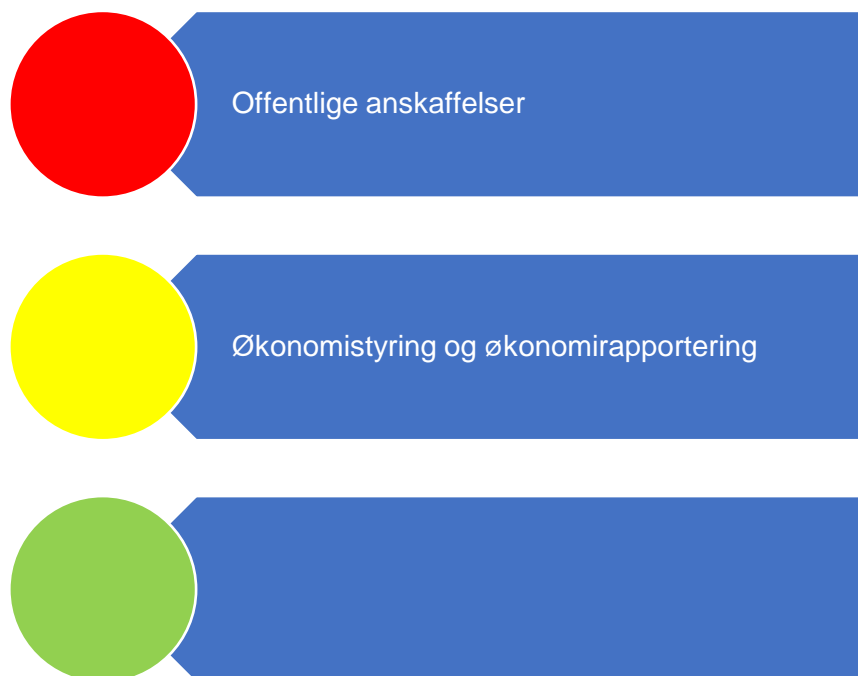
Figur 1. Risikovurdering økonomi

Figur 1 er en oppsummering av risikovurderingene som er gjort relatert til økonomi.