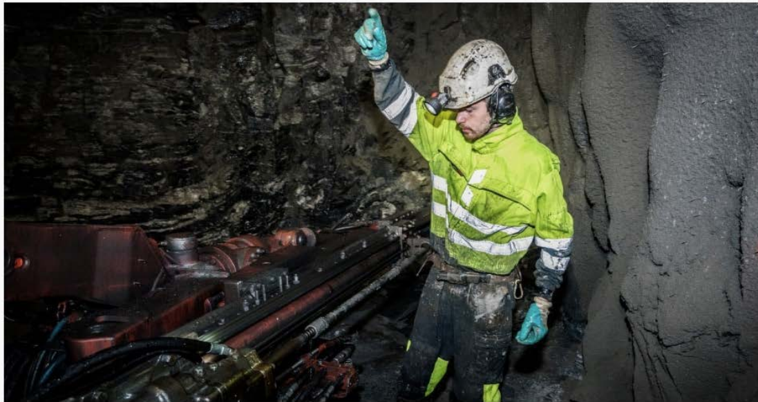
Utbygging av Lysebotn 2 kraftverk.